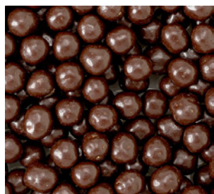
KROC CHOC NERO 1400g

Art. SPV7T Art. SPS7T Art. SPN7T Art. SPP7T