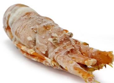
ARAGOSTA COTTA 175/200 INDIA