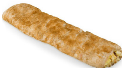
STRUDEL MELE CON PASTA FROLLA PRONTO 2 x 1 kg 'STABINGER'