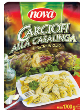
CARCIOFI A SPICCHI IN OLIO ALLA CASALINGA - IN BUSTA 1,7 kg