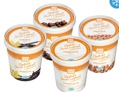
GELATO SENZA LATTOSIO, 500ml 'ERIKA'

Vaniglia Cioccolata Nocciola Fior di Latte