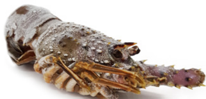
ARAGOSTA VERDE 100/200 MAROCCO