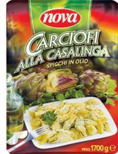
ARTISCHOCKEN IN ÖL 'ALLA CASALINGA' - ALUBEUTEL 1,7 kg