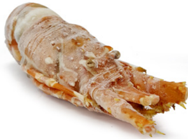
LANGUSTE GEKOCHT 175/200 INDIEN