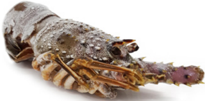
GRÜNE LANGUSTE 100/200 MAROKKO