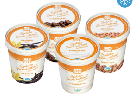
EIS LACTOSEFREI, 500ml 'ERIKA'

Vanille Art. SPV7T Schokolade Art. SPS7T Haselnuss Art. SPN7T Fior di Latte Art. SPP7T